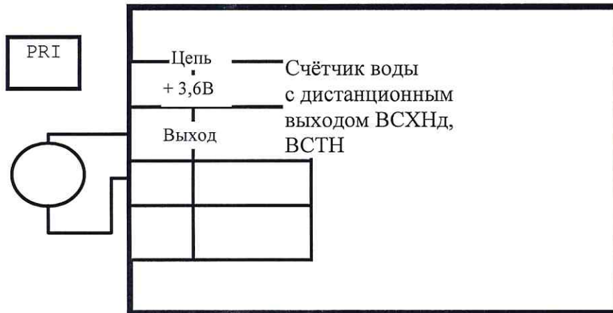
Схема проверки импульсов дистанционного выходного сигнала счётчиков воды ВСХНд, ВСТН.