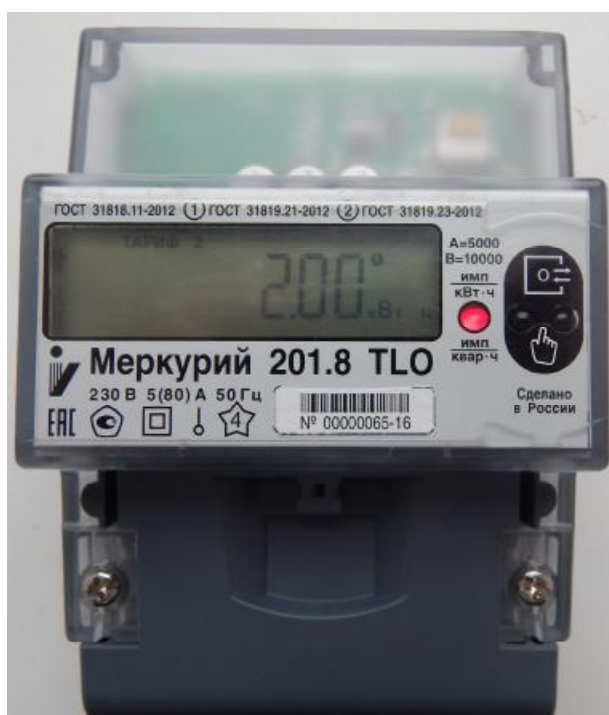
Рисунок 1 - Общий вид счётчиков «Меркурий 201.8TLO»

На рисунке 1 приведена фотография общего вида счётчиков «Меркурий 201.8TLO».